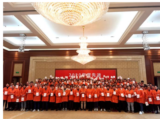
图表2.1-8 优秀员工表彰