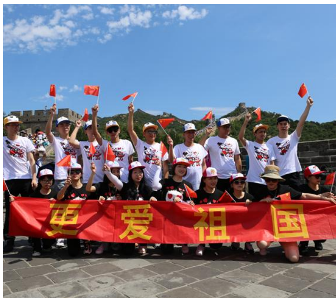
6.2-2 长城齐唱《我的祖国》

公司也十分重视职工群众的身心健康，工会牵头成立兴趣小组，积极开展活动，并组织员工技能比拼、运动会等活动。职工可以根据自己的爱好特长和情趣，展示自己的才华，充实精神生活，既活跃了职工的精神生活，也增强了企业的向心力和凝聚力。