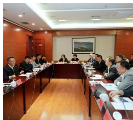
图表2.1-5 职工代表大会