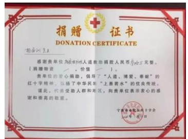
图7.1-1 公益事业支持活动

同时，公司在服装领域发挥着自己的作用，通过先进的现代化技术，在工艺上不断创新，将节能环保做到最大化。先后获得了ISO 14025环境标志证书、绿色环保证书等荣誉。